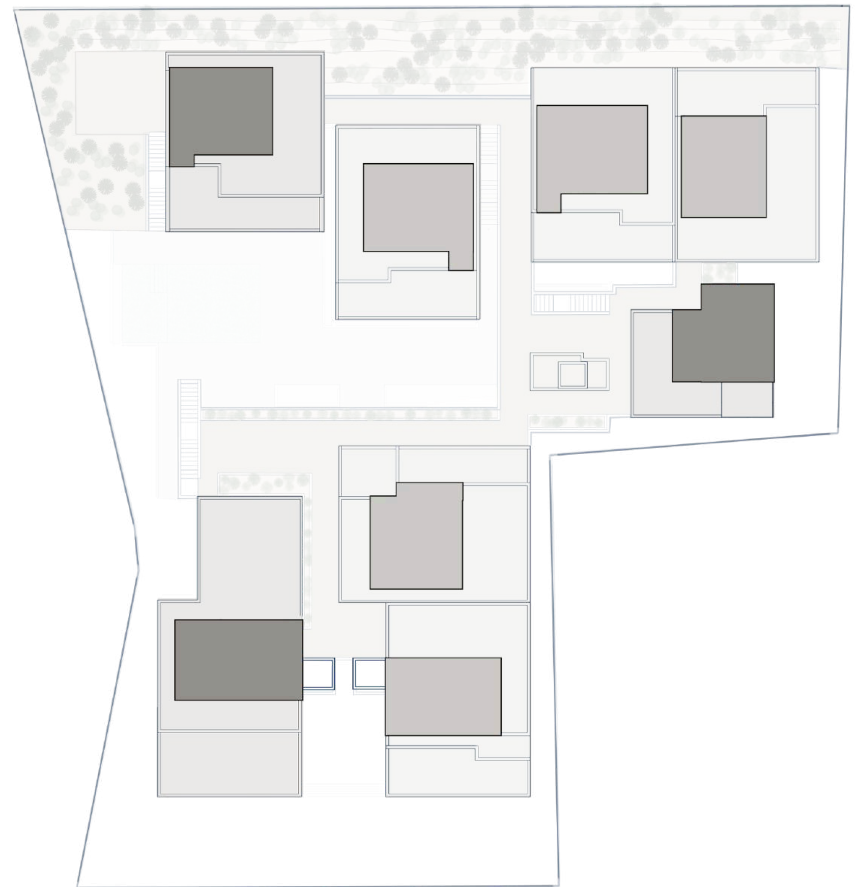
NIVEL 4 - ROOFTOPS